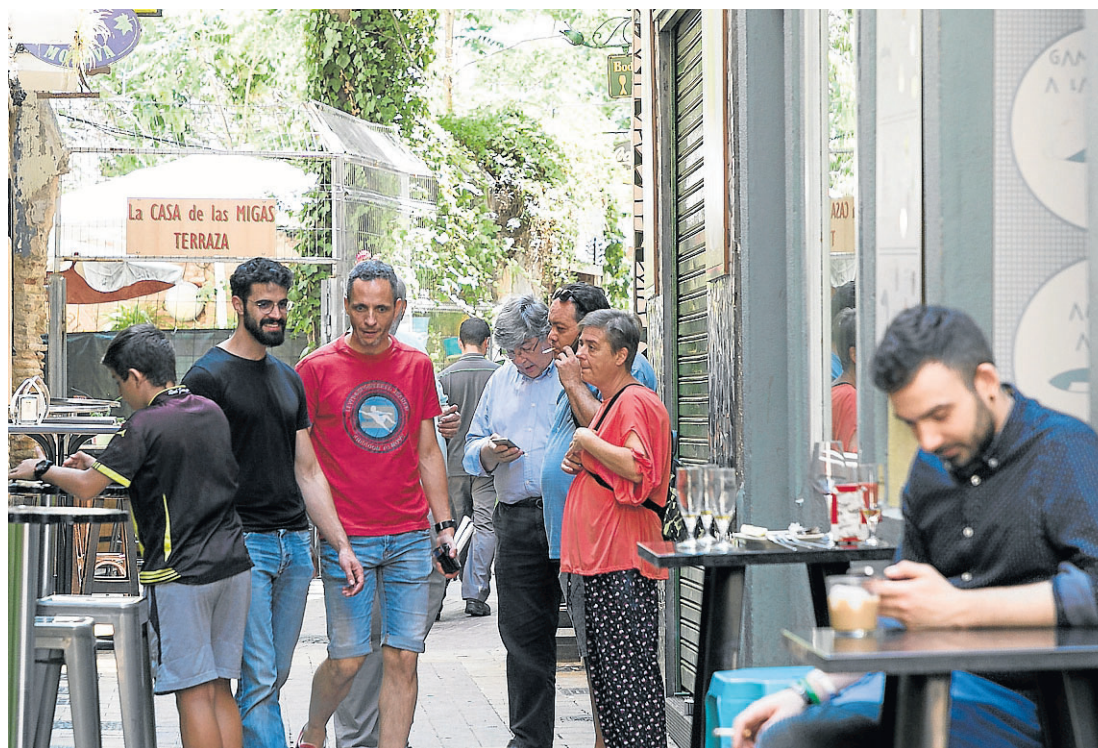
El Tubo es una de las zonas en las que se superan los niveles de ruido con mayor frecuencia. ARÁNZAZU NAVARRO

«Cada vez se quejan más personas. La ocupación de la calle va a más con horarios cada vez más amplios», señala. El colectivo tiene instalados cuatro sonómetros en la capital y espera colocar otros cuatro antes de Navidad. El problema, explica Morte, está en que