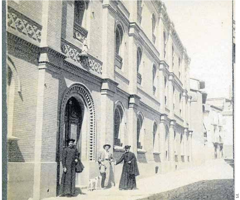
Fotografía en Huesca a finales del siglo XIX.

También está disponible para profesionales y curiosos el plano de Huesca de Casañal que, como recordó la concejala, se pue-