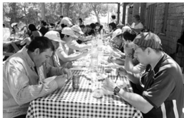
Imagen de Arcadia en La Gabarda. S.E.

Recientemente, la Fundación Agustín Serrate visitó La Gabarda, iniciando así una actividad denominada "Sábados en acción". Se trata de una iniciativa que tiene por objeto integrar a las familias como participantes y acompañantes de las actividades de fin de semana del Centro de Día Arcadia, colaborando en los preparativos y manteniendo la ilusión. En esta ocasión, la entidad estuvo acompañada de algunos niños que disfrutaron con sus padres de un día espléndido de actividades y buen ambiente. En grupo siempre se superan las dificultades, aseguran desde la asociación en un comunicado. D.A.