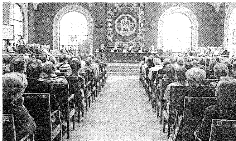
El acto de inauguración se celebró el pasado día 7 de octubre

El curso 2014-2015 cuenta con un nuevo número récord de alumnos, elevándose hasta un total de 1.300 alumnos en toda la geografía aragonesa, ya que además de las sedes de las tres capitales de provincia, continúa en las subdesdes de Sabiñánigo, Utebo, Jaca, Barbastro, Calatayud, Ejea de los Caballeros, Monzón, Alagón y Fraga, a las que este año se