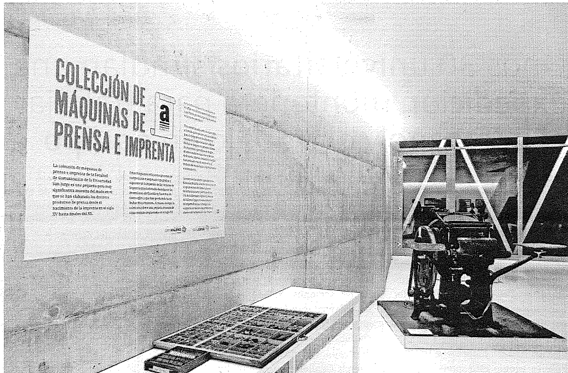
La muestra tiene como objetivo difundir y poner en valor esta colección