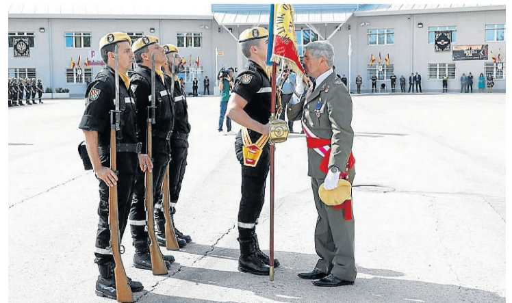
El general aragonés Miguel Alcañiz se despide de la enseña. UME